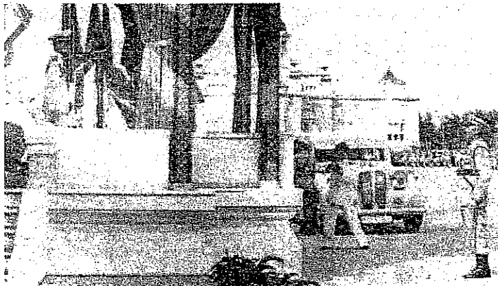
พิธีกล่าวคำสัตย์ปฏิญาณตนและสวนสนาม เมื่อวันที่ 13 ตุลาคม พ.ศ.2495 ณ ลานพระราชวังดุสิต

พิธีกล่าวคำสัตย์ปฏิญาณตนและสวนสนามของนักเรียนนายร้อยตำรวจ และหน่วยตำรวจต่าง ๆ ที่สำคัญและถือเป็นประวัติศาสตร์ อันเป็นสิริมงคลแก่กองข้าราชการตำรวจอย่างยิ่ง เพราะด้วยพระมหากรุณาธิคุณแห่งองค์พระบาทสมเด็จพระเจ้าอยู่หัว ได้เสด็จพระราชดำเนินทรงเป็นองค์ประธาน ในการกล่าวคำสัตย์ปฏิญาณตน ทรงทอดพระเนตรการเดินสวนสนาม และทุกครั้งได้พระราชทานพระบรมราโชวาท ซึ่งนับเป็นพระมหากรุณาธิคุณอย่างสูงยิ่ง มี 3 ครั้ง ดังนี้ ครั้งที่ 1 เมื่อวันที่ 13 ตุลาคม พ.ศ.2495 ณ ลานพระราชวังดุสิต (ลานพระบรมรูปทรงม้า) ในครั้งนั้นพระบาทสมเด็จพระเจ้าอยู่หัว เสด็จพระราชดำเนินเป็นองค์ประธาน ได้พระราชทานธงชัยประจำหน่วยโรงเรียนนายร้อยตำรวจ และหน่วยตำรวจรวม 6 หน่วย มีพิธีกล่าวคำสัตย์ปฏิญาณตนและสวนสนาม พระบาทสมเด็จพระเจ้าอยู่หัวทรงทอดพระเนตรการเดินสวนสนามของหน่วยตำรวจ ทรงพระราชทานพระบรมราโชวาท และมีพระราชกระแสรับสั่งผ่านทางกรมราชองครักษ์ ชมเชยการสวนสนามของหน่วยตำรวจ (หนังสือกรมราชองครักษ์ที่ 830/2495 ลงวันที่ 14 ตุลาคม พ.ศ.2495) ถึง อธิบดีกรมตำรวจ ความตอนหนึ่งว่า.... ได้ทอดพระเนตรเห็นการสวนสนาม ได้กระทำไปด้วยความเข้มแข็งองอาจ และพร้อมเพรียงดียิ่ง นามชมเชยฯ